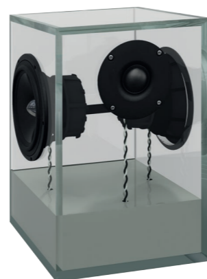
fenstergrau | window grey RAL 7040