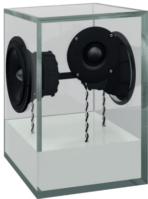
reinweiss | pure white RAL 9010

Optiwhite Glas partiell lackiert. | Optiwhite glass partially colored.