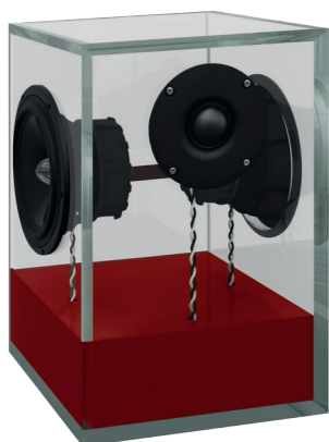
rubinrot | ruby red RAL 3003