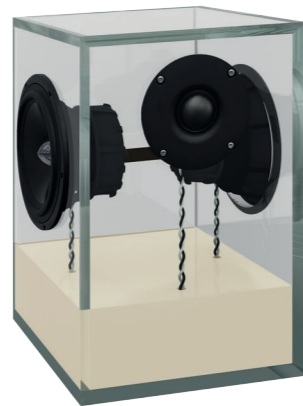
perlweiss | pearl white RAL 1013