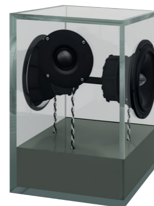
betongrau | concrete grey RAL 7023