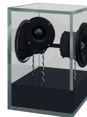
anthrazitgrau | anthracite grey RAL 7016