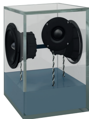
pastellblau | pastel blue RAL 5024