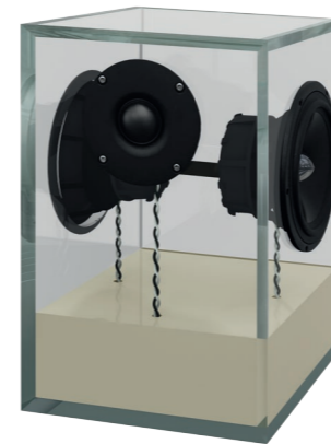
seidengrau | silk grey RAL 7044