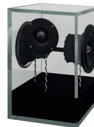
tiefschwarz | jetblack RAL 9005

Hier sehen Sie die partiell lackierte Variante von QEOS II.